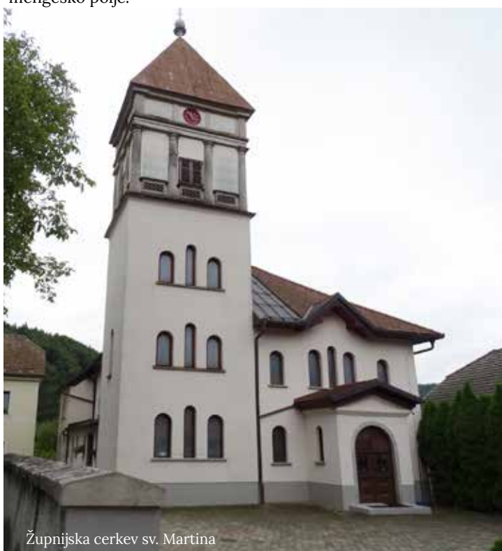
Župnijska cerkev sv. Martina