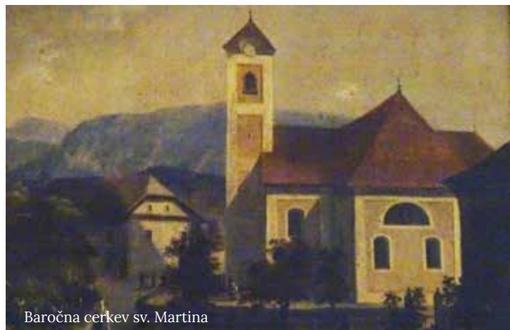
Baročna cerkev sv. Martina

Za župnijo Šmartno v Tuhinju je letošnje leto jubilejno leto, saj mineva 60 let od posvetitve sedanje župnijske cerkve sv. Martina. Župnija Šmartno v Tuhinju je bila v obdobju 1944–1960 brez svoje cerkve, saj je bila nekdanja baročna cerkev sv. Martina, ki je stala na kraju sedanjega spominskega parka na pokopališču, leta 1944 minirana in dokončno leta 1955 skupaj z zvonikom porušena.