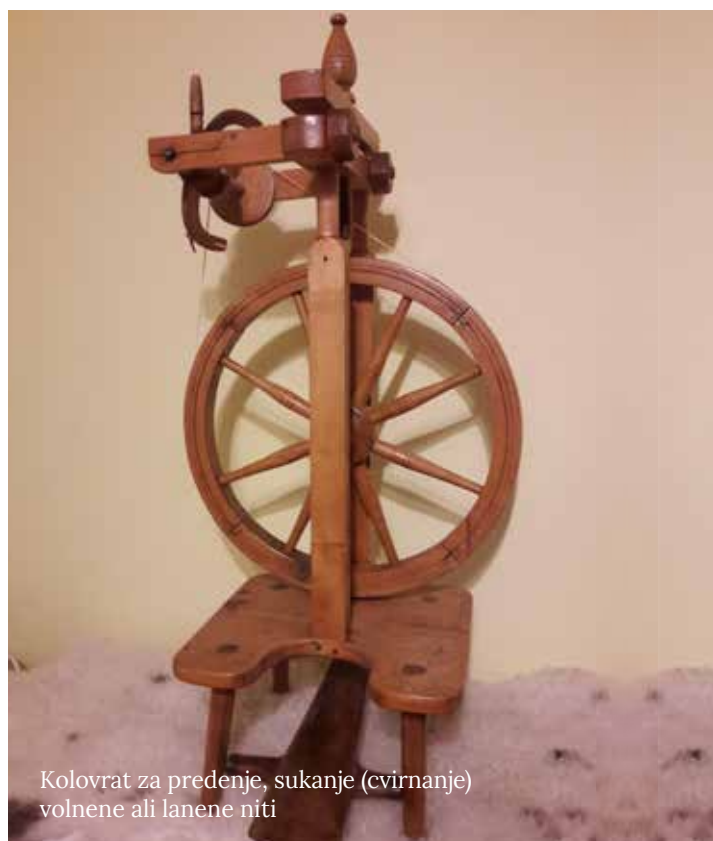
Kolovrat za predenje, sukanje (cvirnanje) volnene ali lanene niti