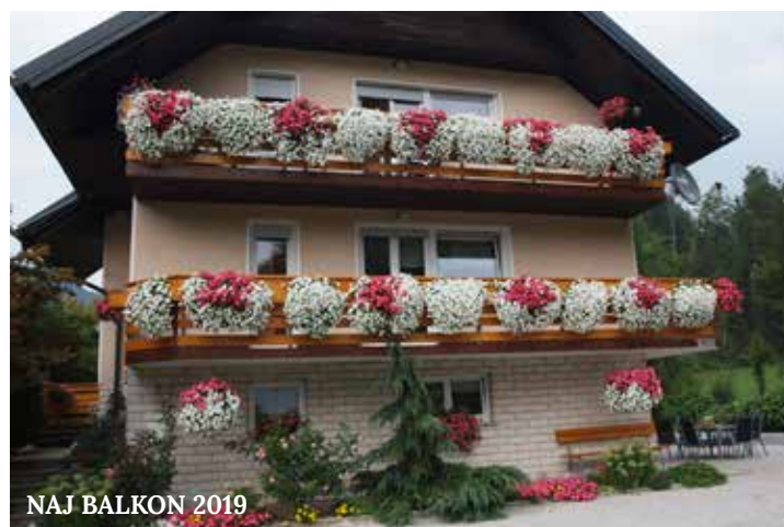
NAJ BALKON 2019